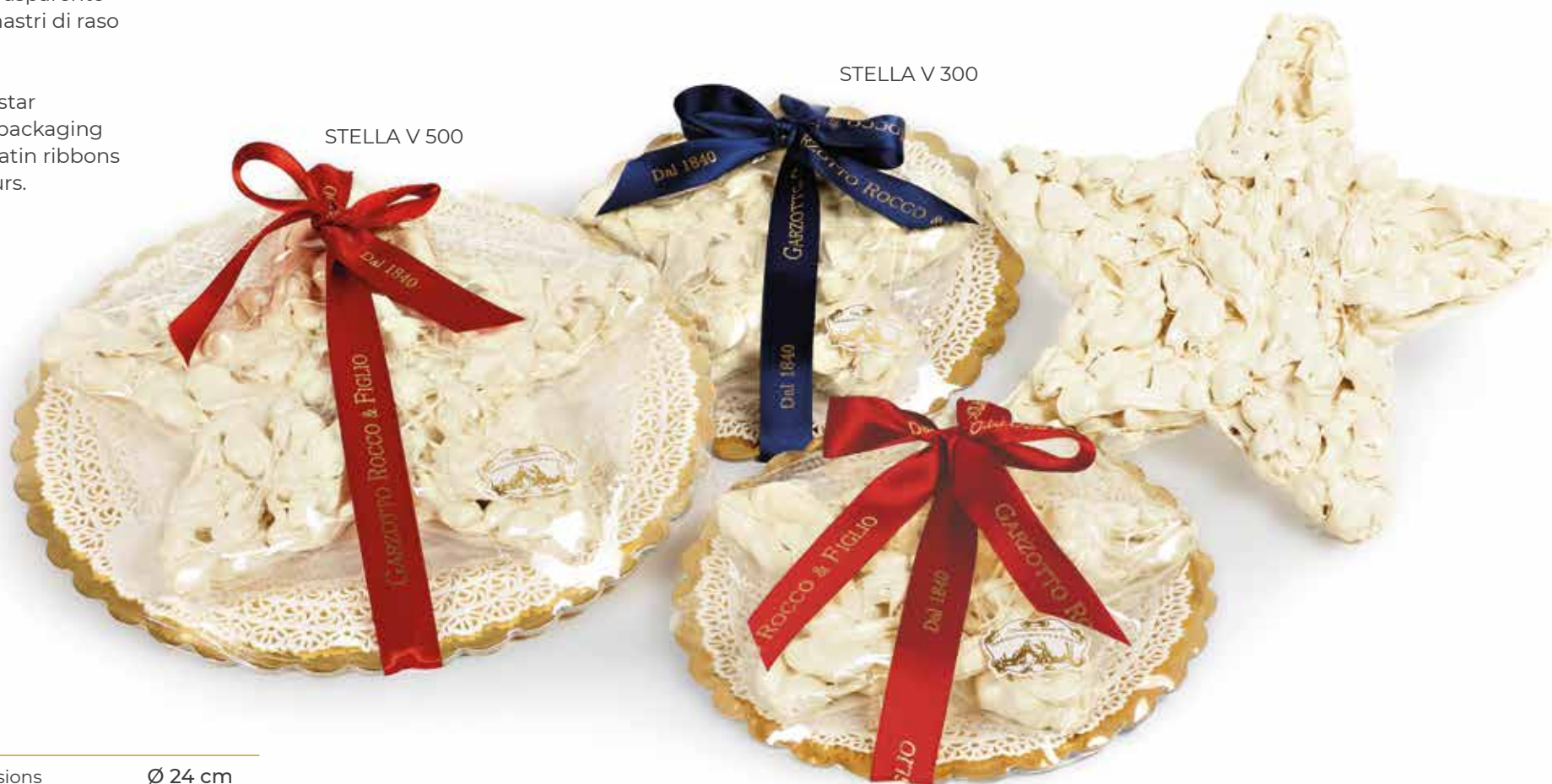
STELLA V 500

The Christmas star in transparent packaging adorned with satin ribbons of various colours.