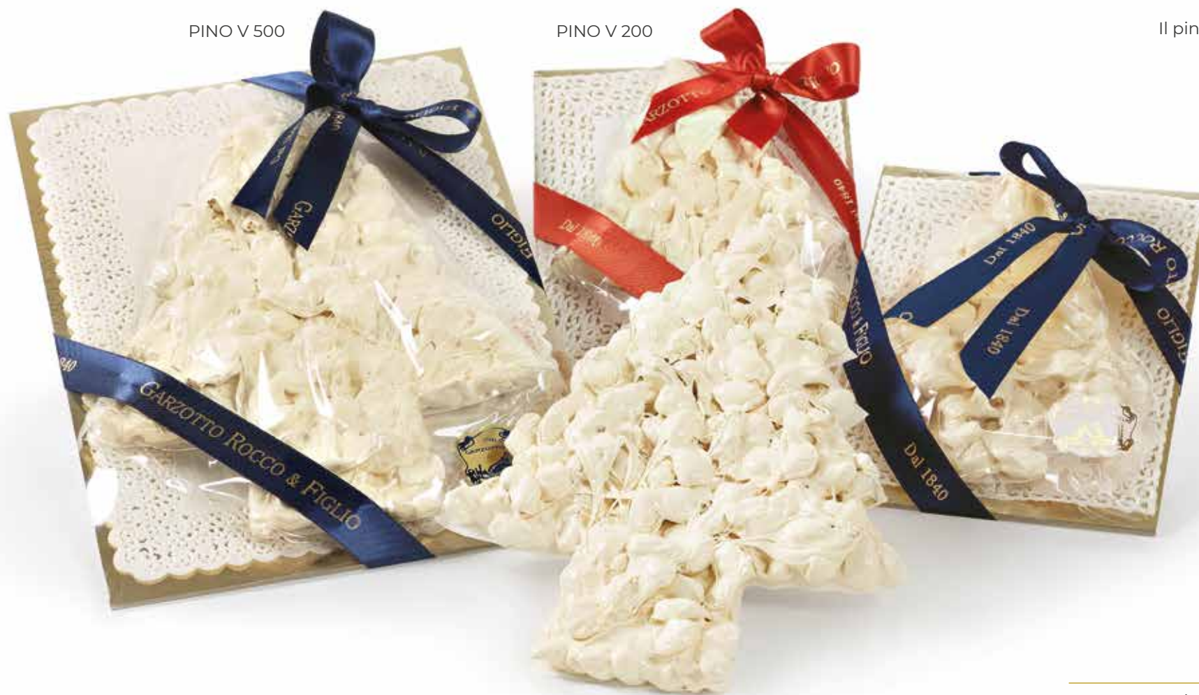
PINO V 500

A Christmas symbol returns, packaged in transparent cellophane.